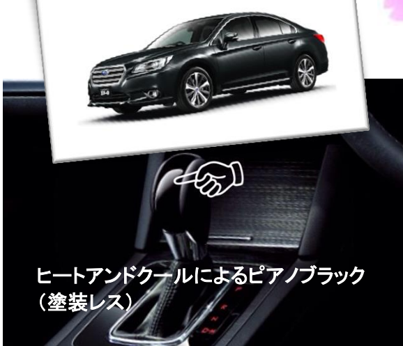
ヒートアンドクールによるピアノブラック (塗装レス)