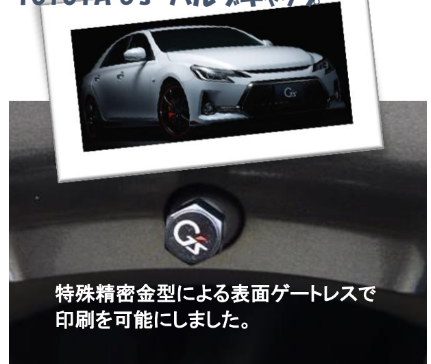
特殊精密金型による表面ゲートレスで 印刷を可能にしました。