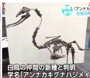
群馬県立自然史博物館 京都大学 22年前 群馬 安中市の 約1,150万年前の地層で発見の化石を研究